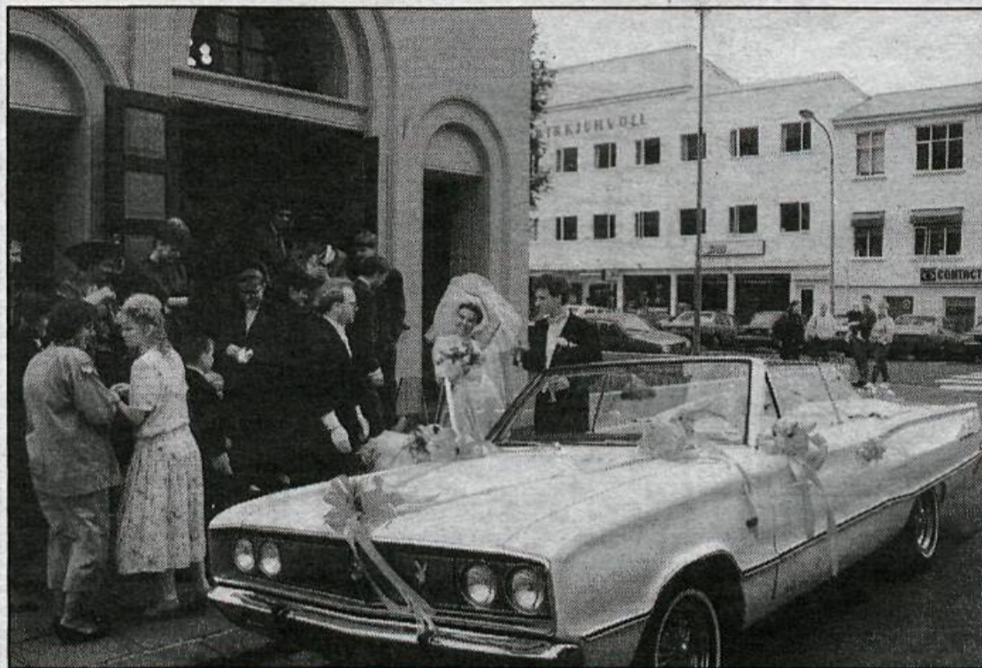
Brúðhjónin búa sig undir að skála í kampavini fyrir utan kirkjuna.

Og svo var einhver að segja, að Maggie Thatcher væri ekki kvenmaður. Fyrr má nú aldellis fyrr vera!